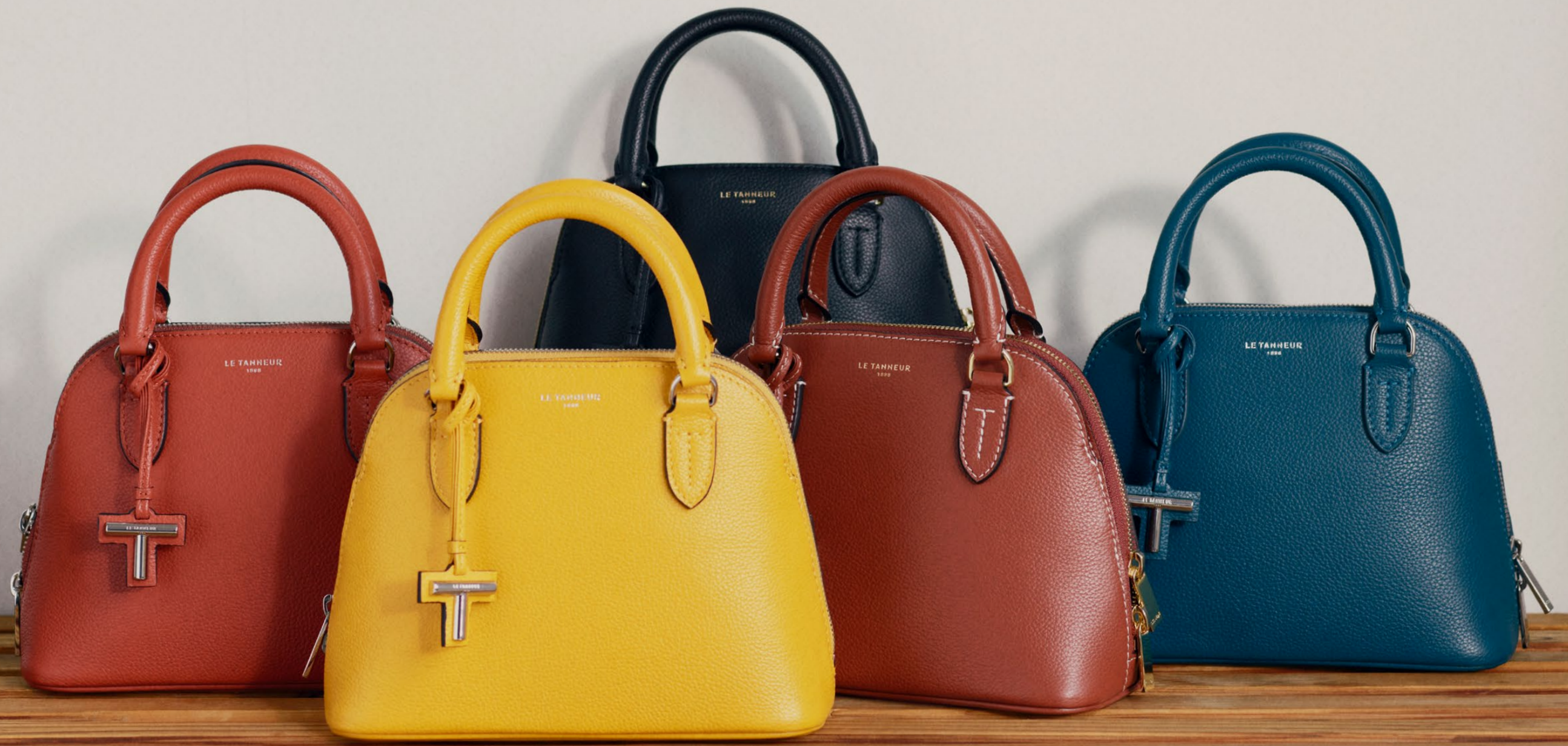
Gisèle – Petit sac à main Gisèle – Small handbag