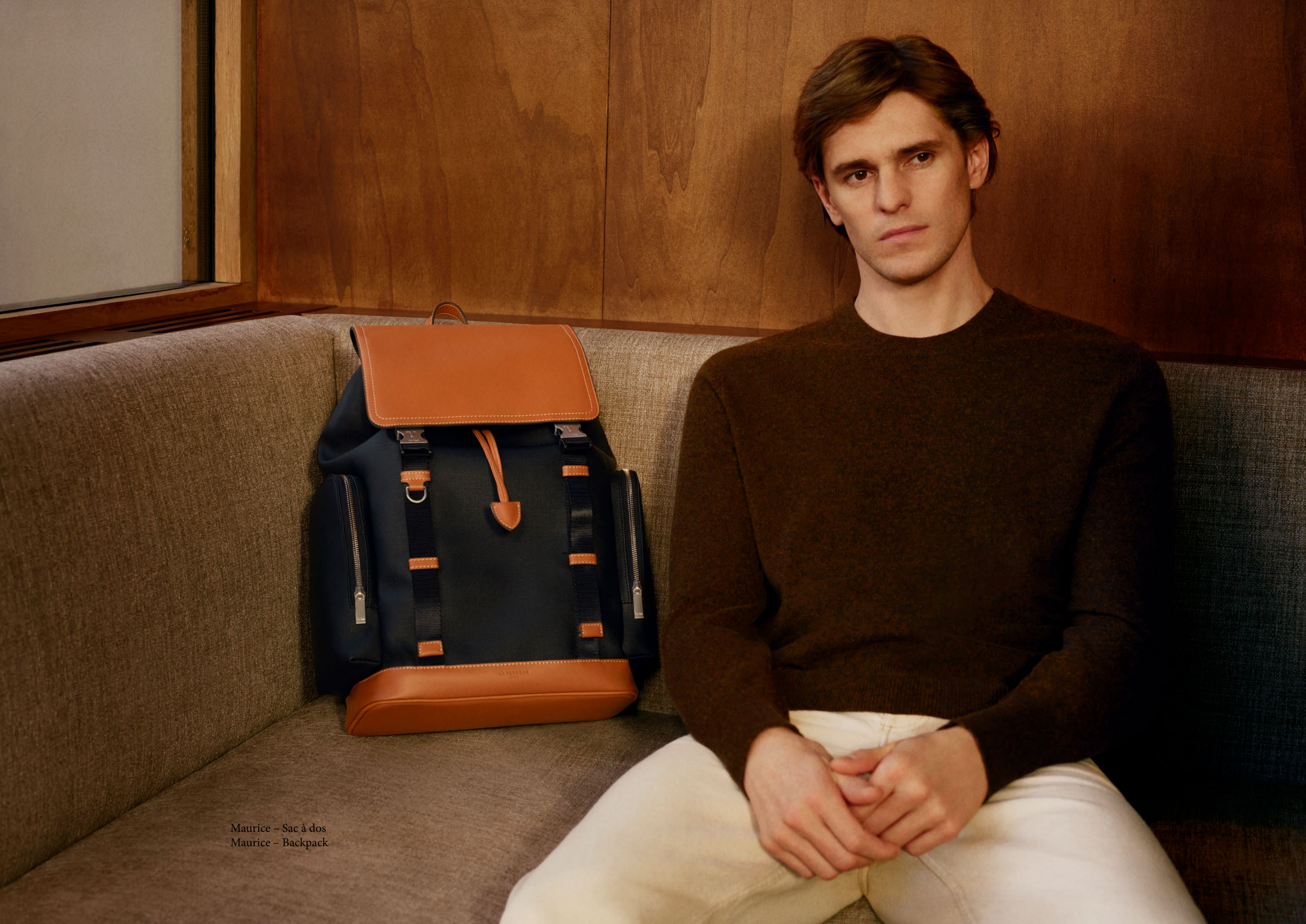
Maurice – Sac à dos Maurice – Backpack