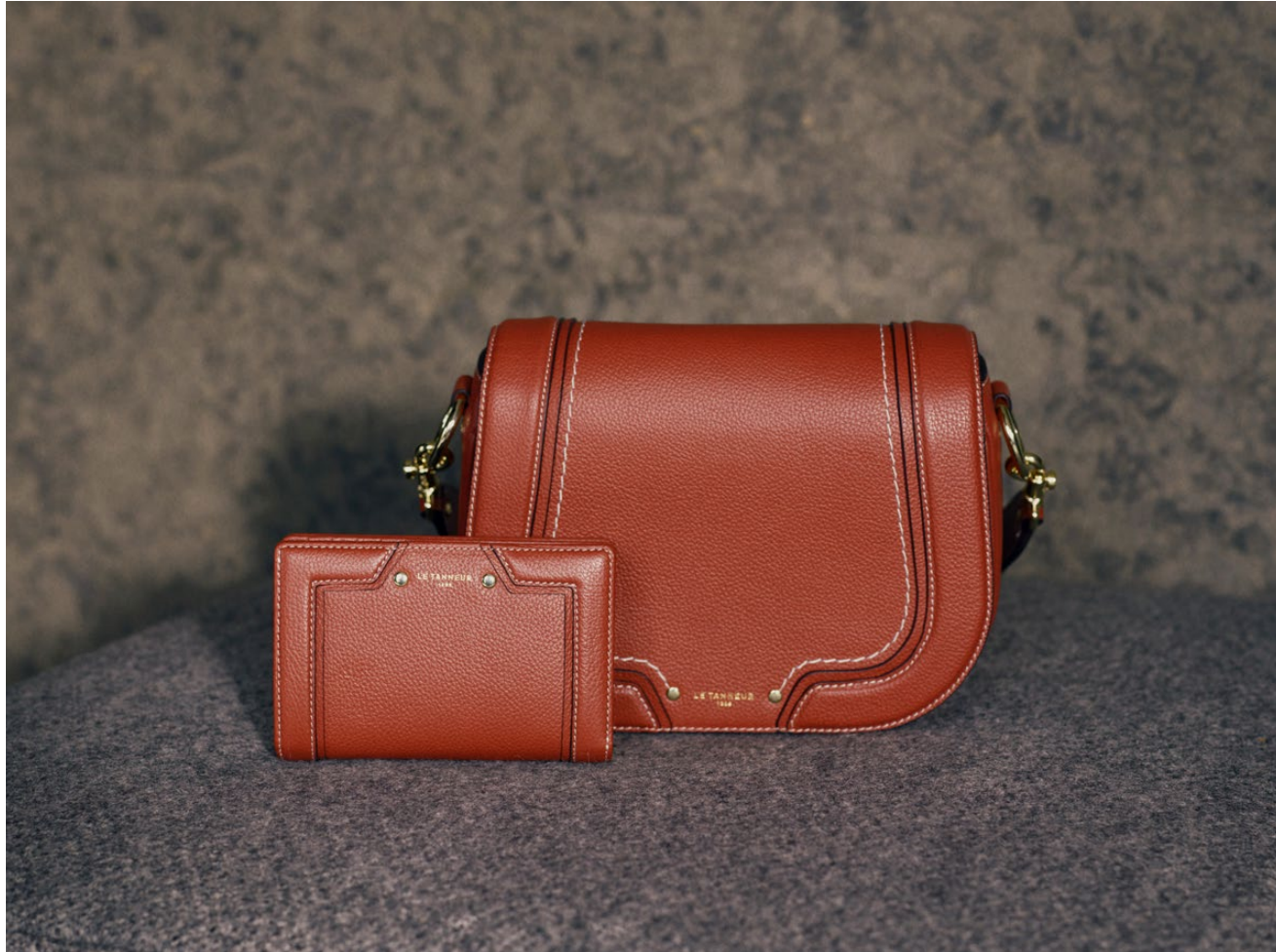
Ella – Portefeuille & petit sac à main Ella – Wallet & small handbag