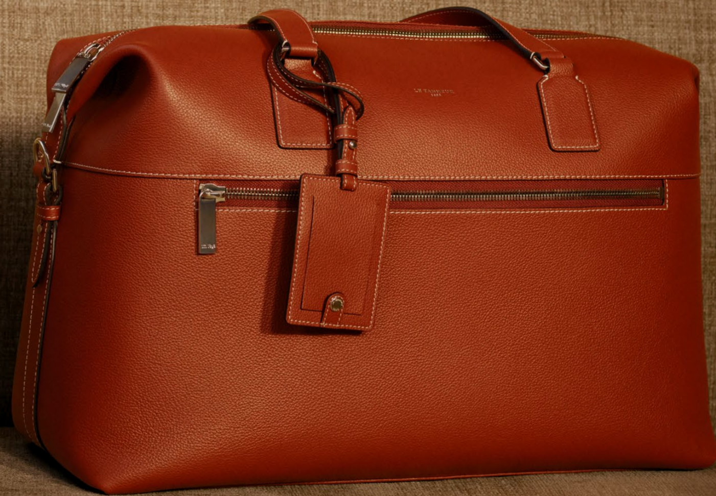
Émile – Sac de voyage Émile – Travel bag