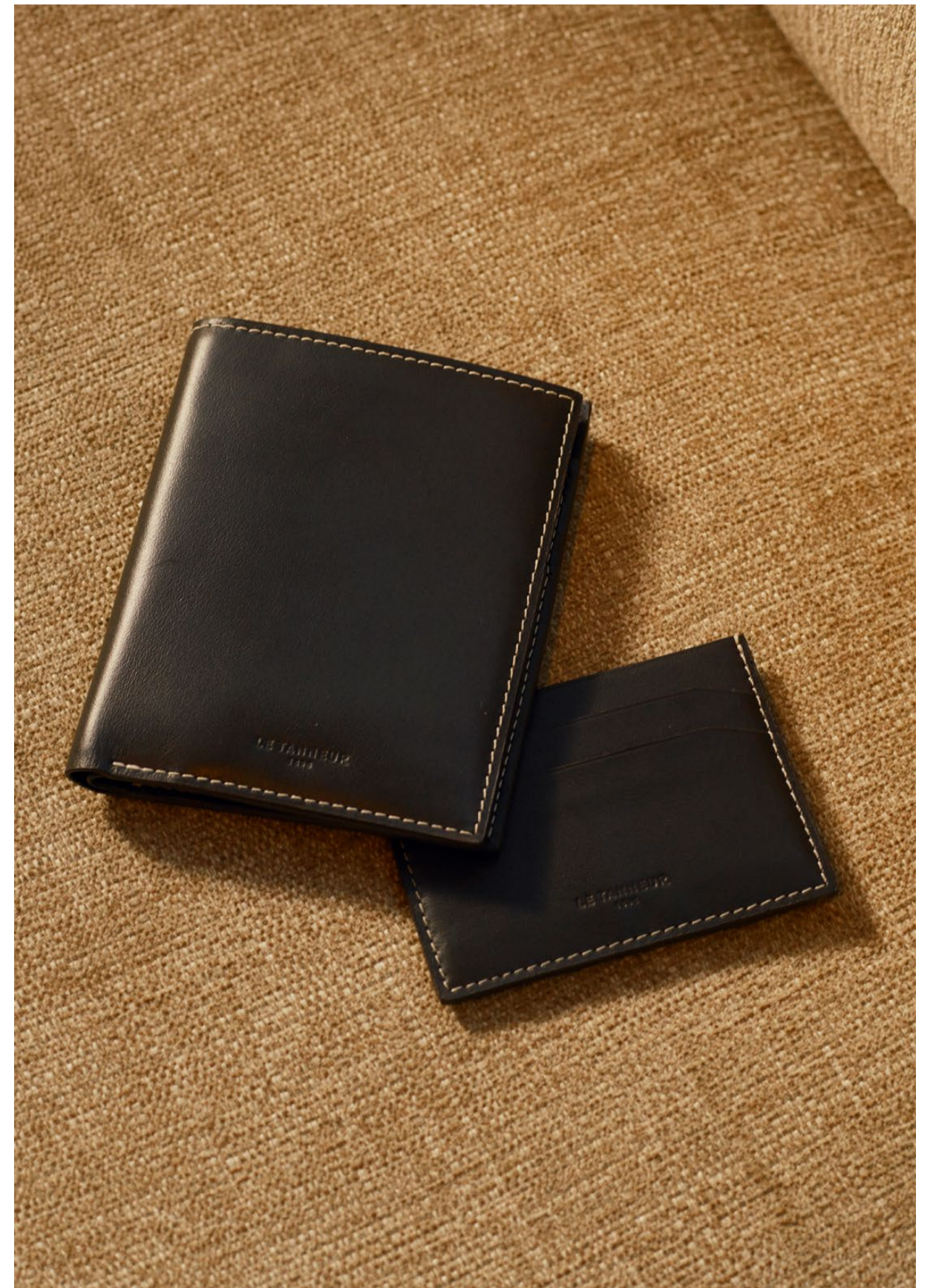
Léon – Portefeuille & Porte cartes Léon – Wallet & card holder