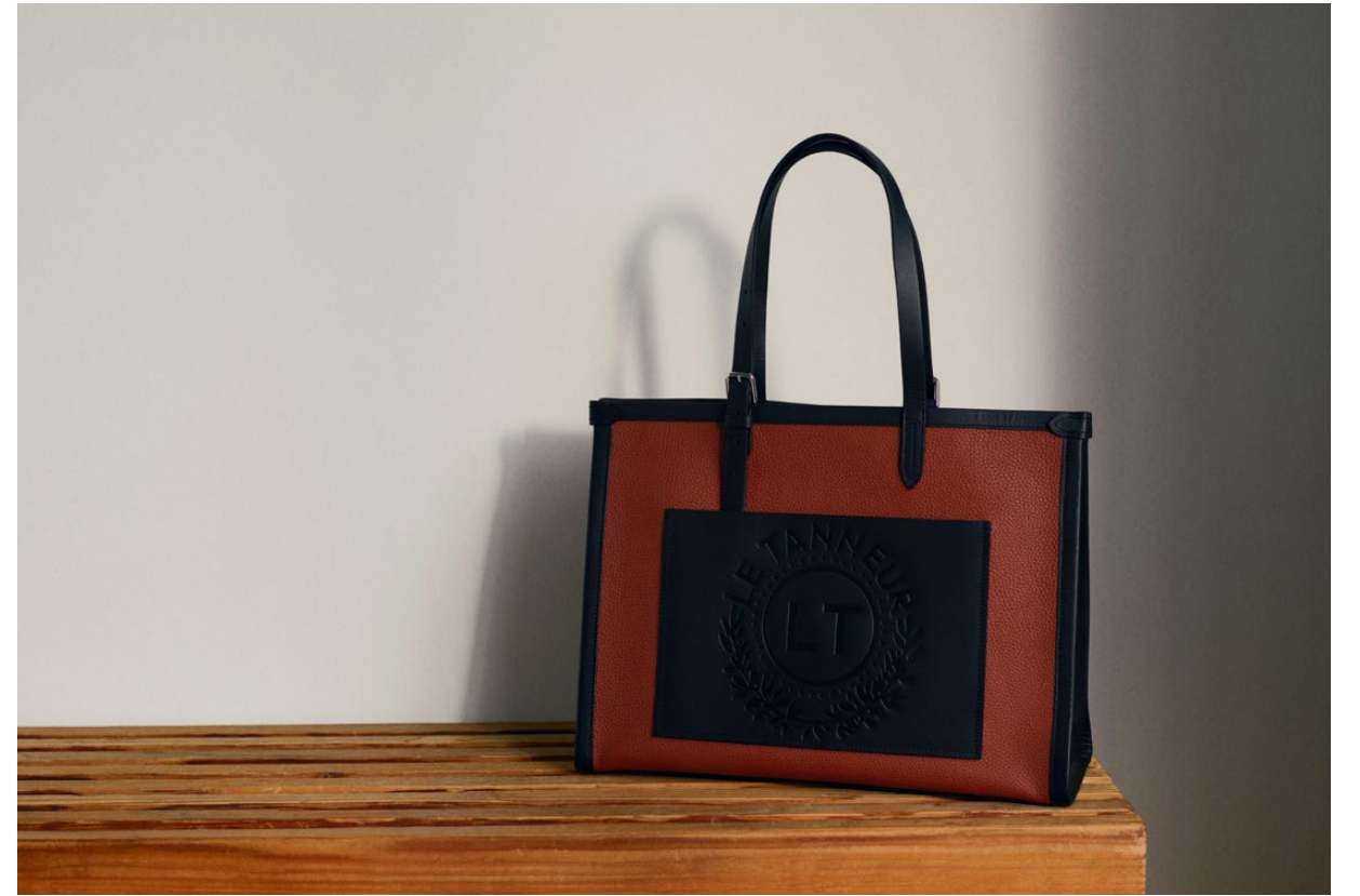
125 – Sac cabas 125 – Tote bag