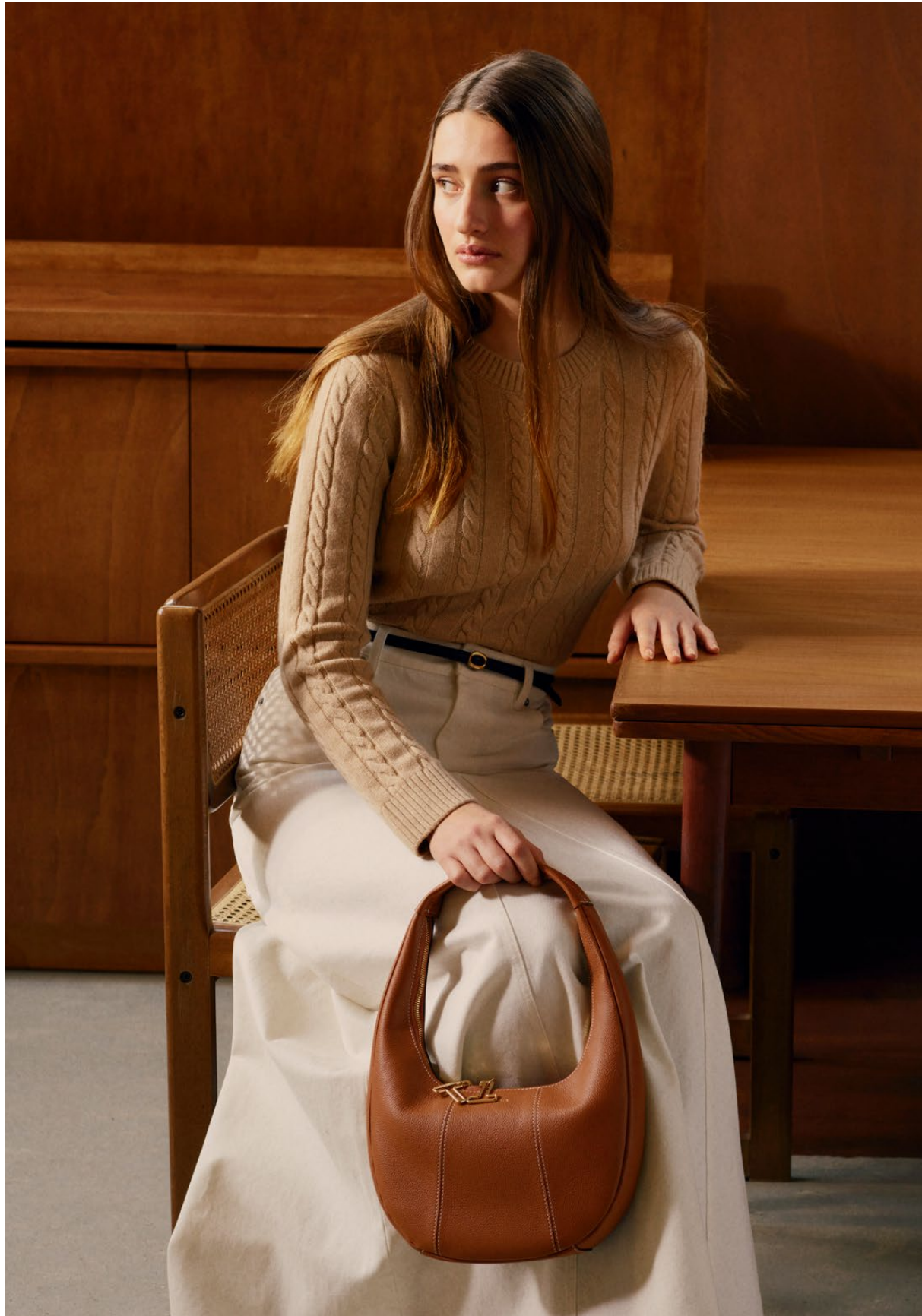
Juliette – Petit sac hobo Juliette – Small hobo bag