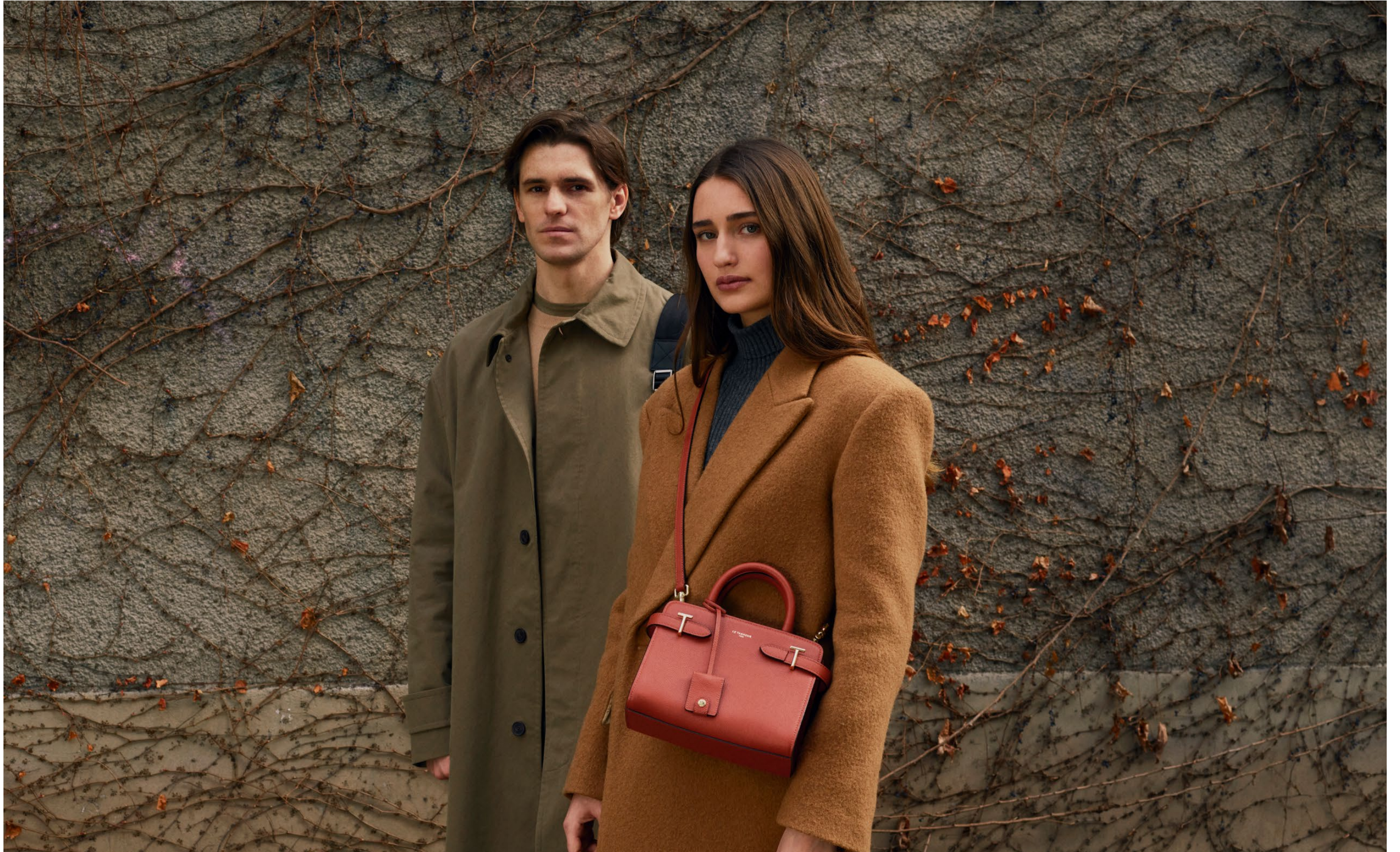
Émilie – Petit sac à main Émilie – Small handbag