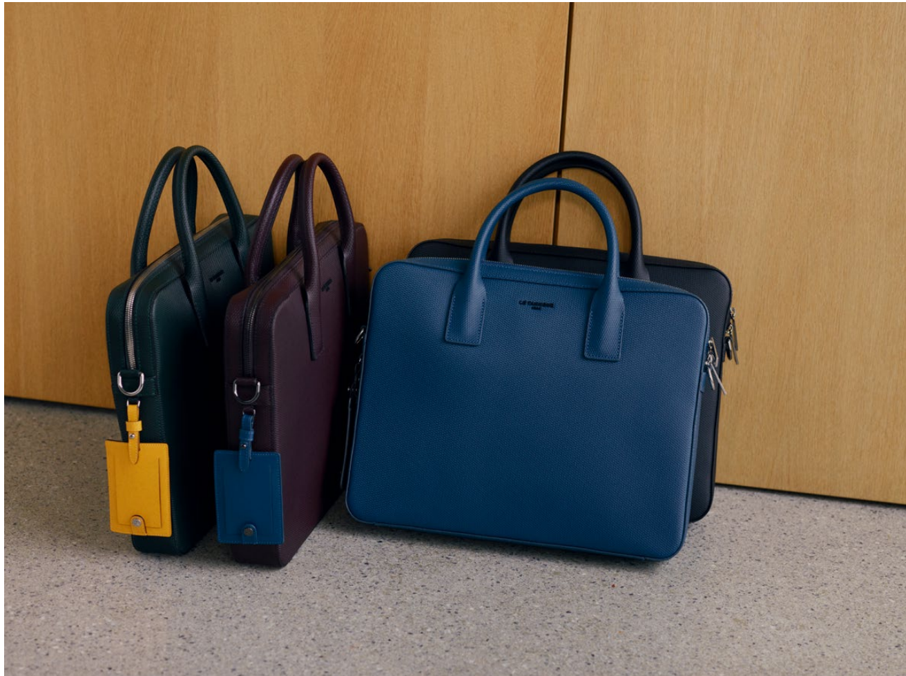
Émile – Porte-documents Émile – Briefcase