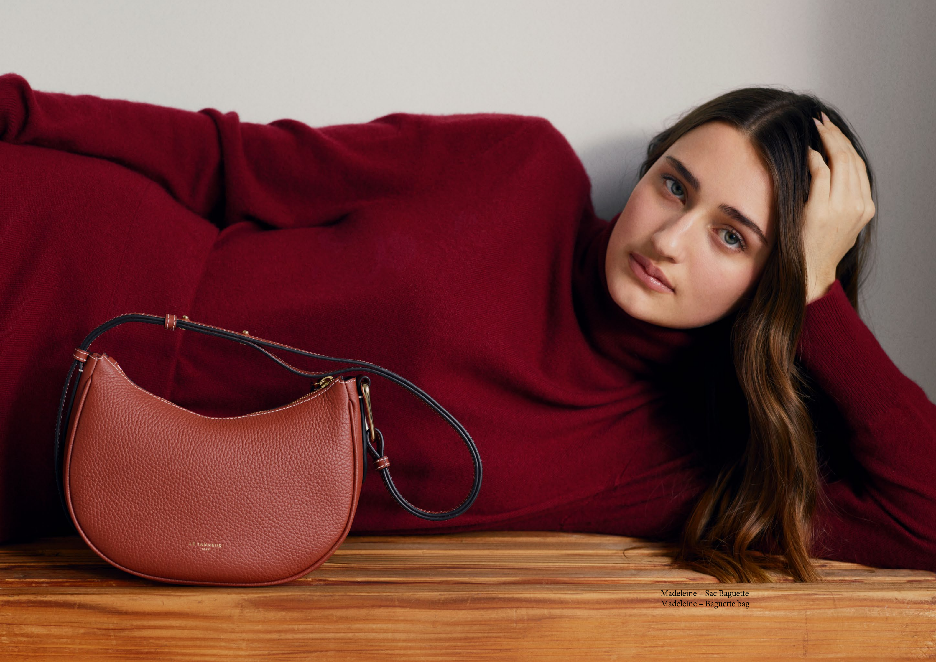
Madeleine – Sac Baguette Madeleine – Baguette bag