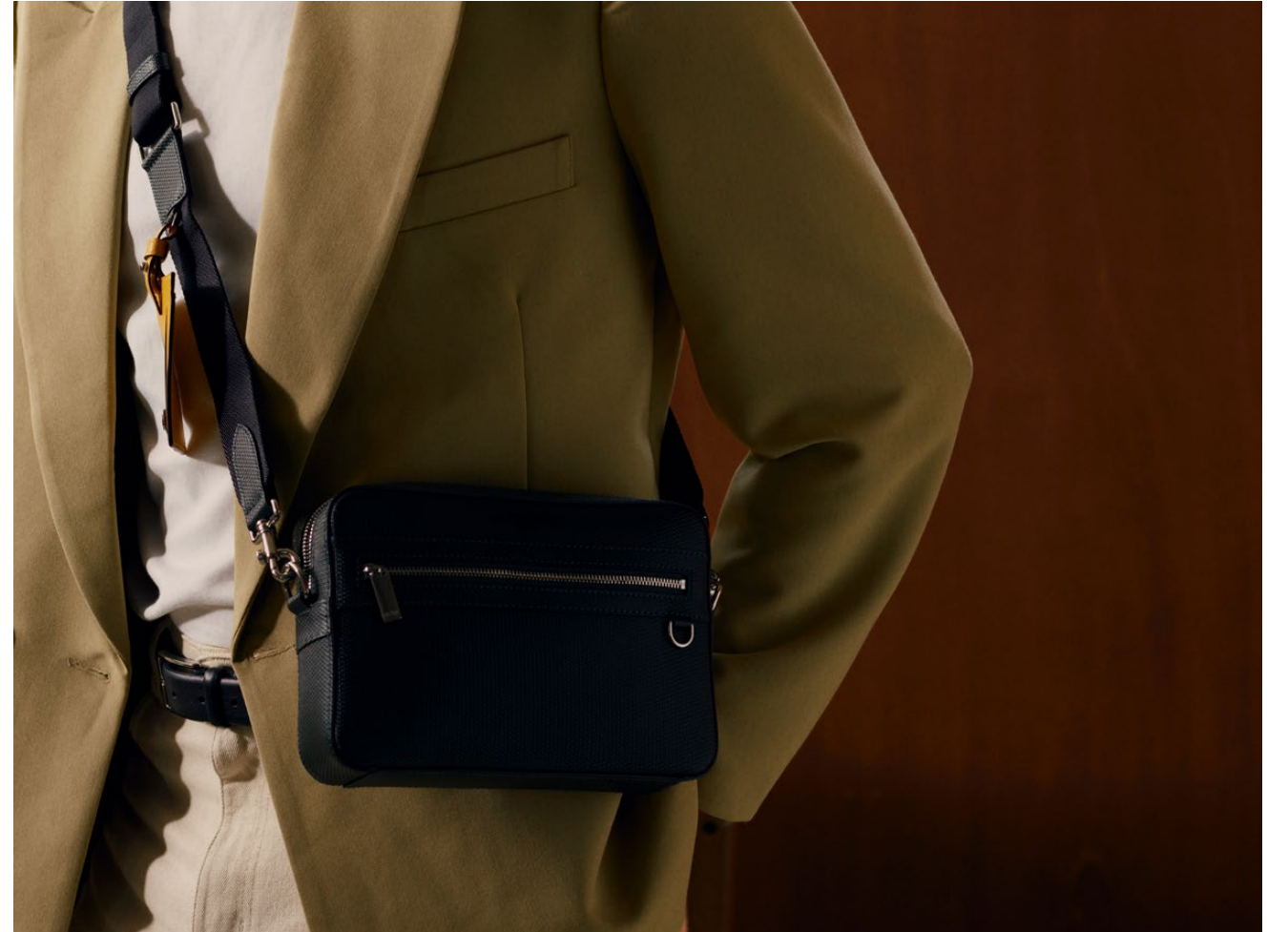
Émile – Crossbody bag Émile – Reporter