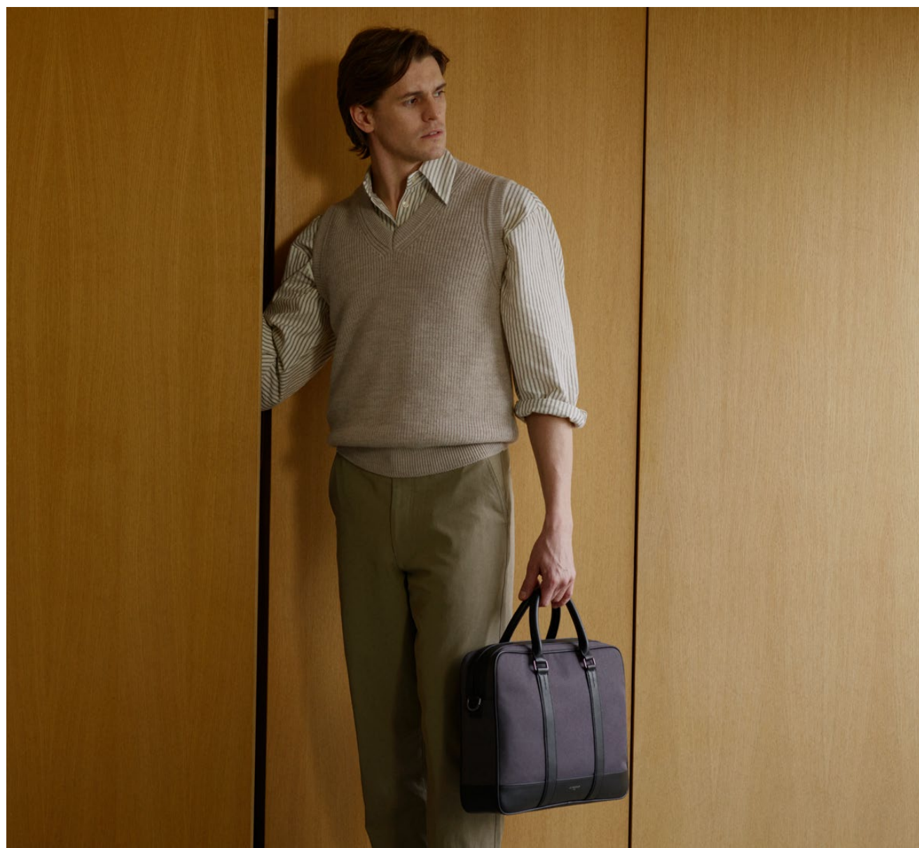
Gaspard – Porte-documents Gaspard – Briefcase