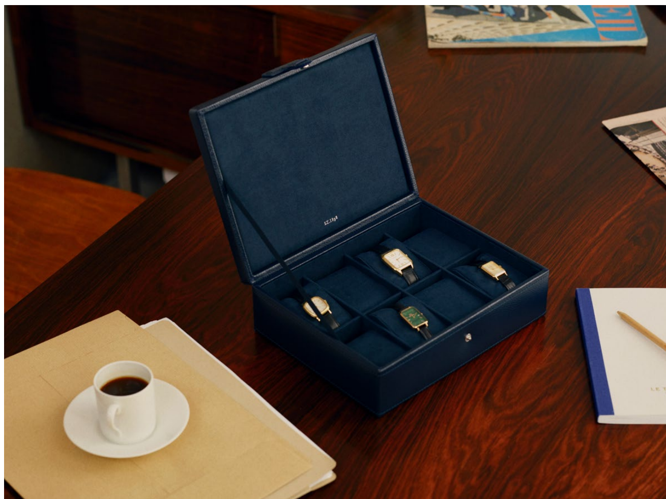
Boite à montres Watch case