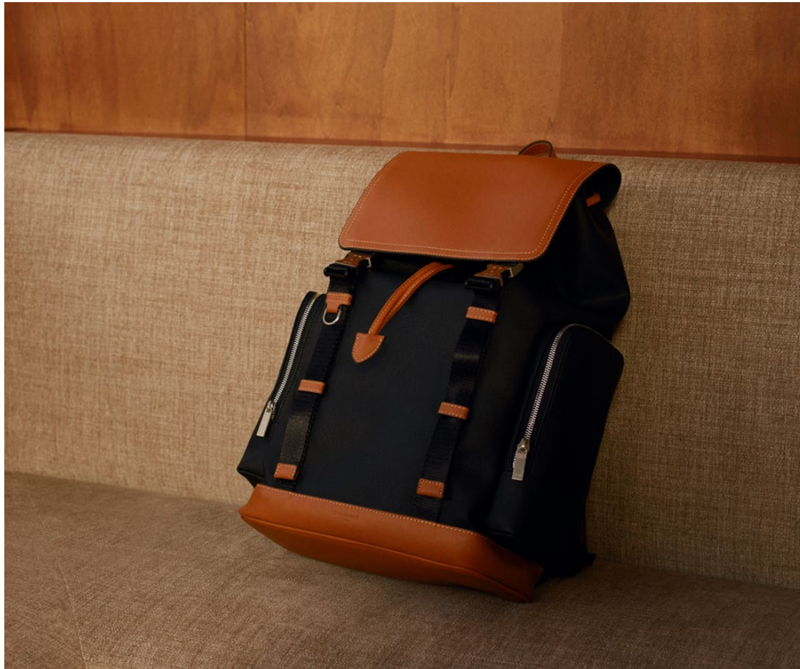
Maurice – Sac à dos Maurice – Backpack