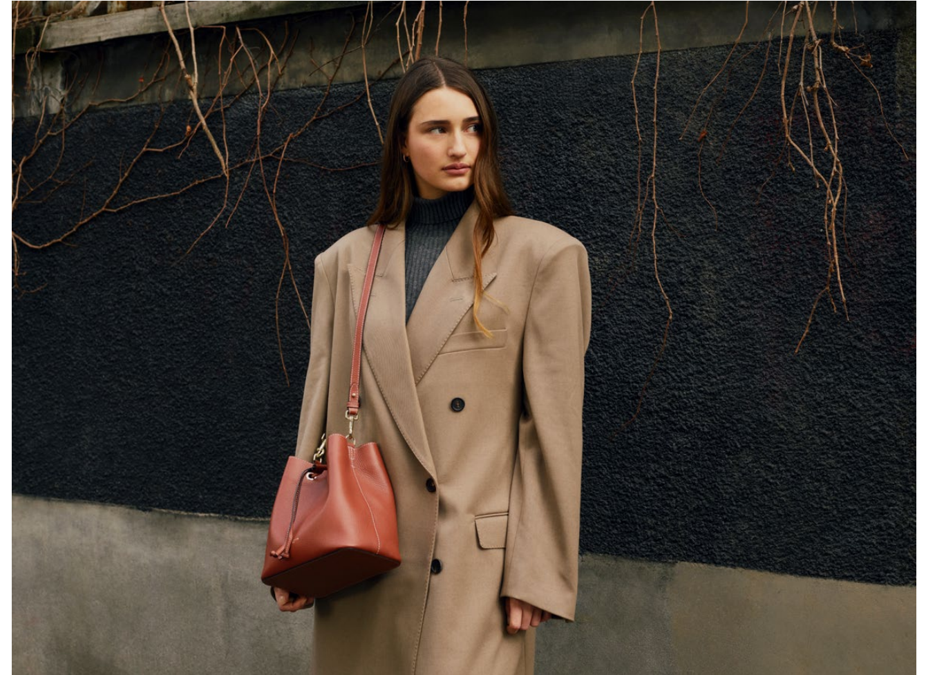
Louise – Petit sac sceau Louise – Small bucket bag