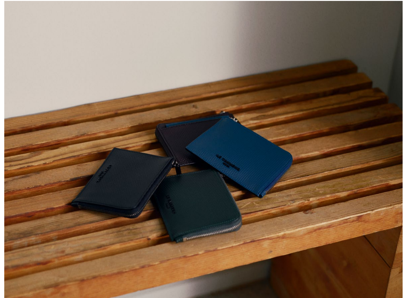
Émile – Portefeuille Émile – Wallet