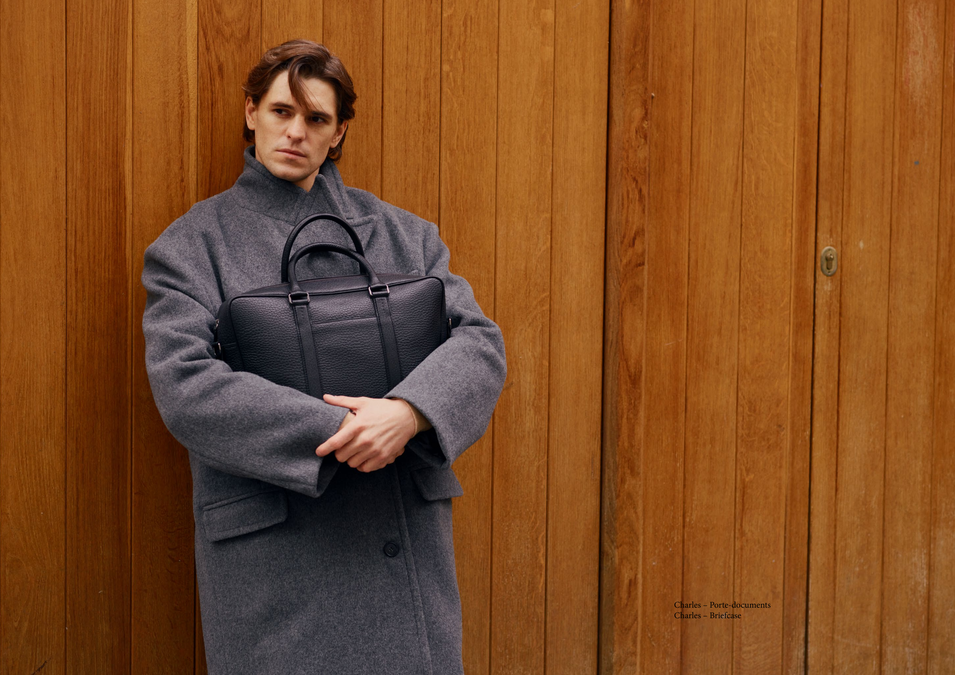
Charles - Porte-documents Charles - Briefcase