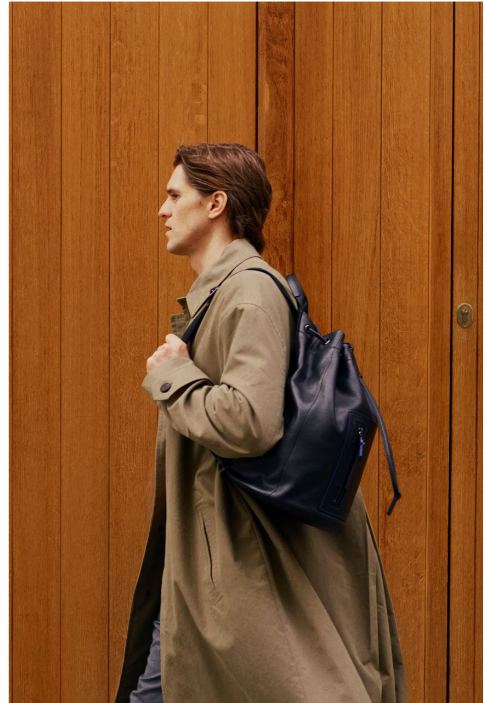
Alexis – Sac à dos Alexis – Backpack